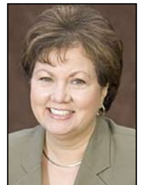
Elaine Alquist was one of 10 Senators to receive a perfect liberal score.