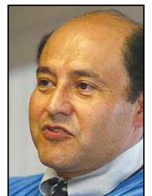
Lou Correa was once again the Senate’s most conservative Democrat.