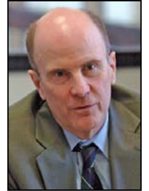
Is Mark Wyland the state’s most conservative Senator?